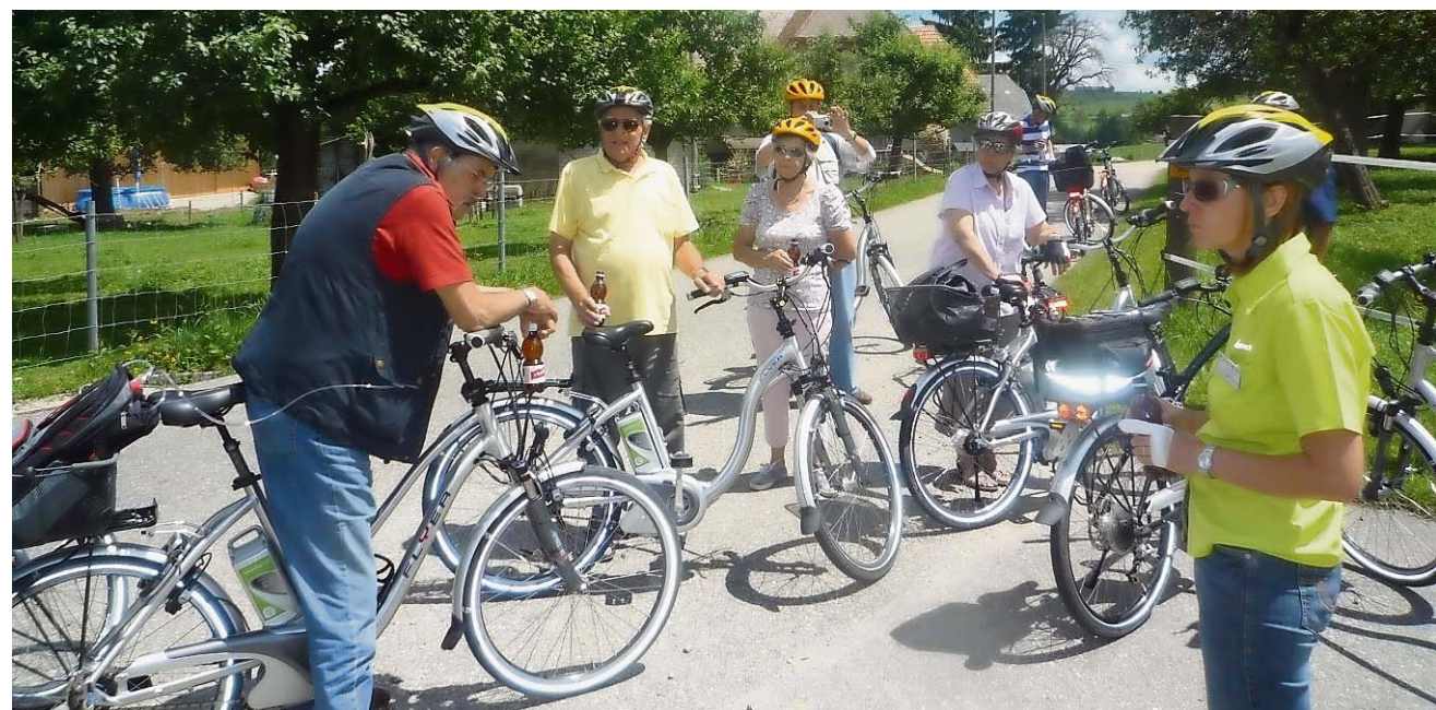
Ein Ausflug mit Sauerstoff-Patienten ist logistisch sehr anspruchsvoll.

Bestellung/Info unter www.vier-quellenweg.ch , ISBN 978-3-906200-46-0.