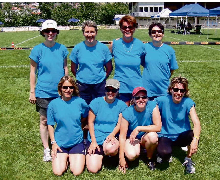
Frauenriege Lüterkofen am Kantonalturnfest in Balsthal.

Unbeschwert und keck bewältigte die 40-köpfige Jugendabteilung ihre Aufgaben. Der 9. Rang und die 24,99 Punkte zeigen auf, dass guter Nachwuchs in Zukunft für frischen Wind sorgen könnte. Die Leichtathleten in der Mannschaft wie auch im Einzelkämpf der Aktiven sorgten wiederum für Furore. Als Grundlage für das tolle LMM-Ergebnis mit Platz 4 und 13014 Punkten sorgten vorweg Peter Ruchti als Zweitplatzierter und Luca Caspar mit dem 5. Rang in der Einzelkonkurrenz. (MZL)